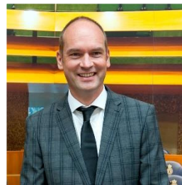
3. Noteer naam en partij