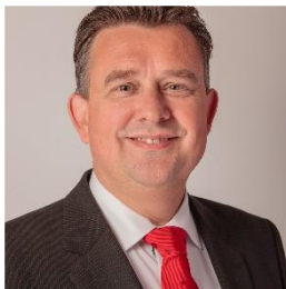
1. Noteer naam en partij