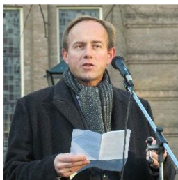
6. Noteer naam en partij