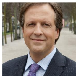
10. Noteer naam en partij