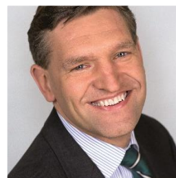
11. Noteer naam en partij