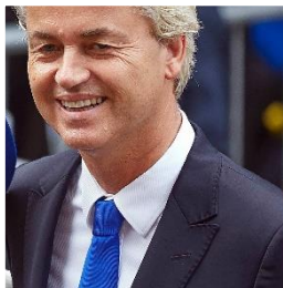
2. Noteer naam en partij