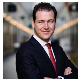
7. Noteer naam en partij