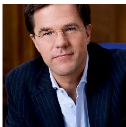
9. Noteer naam en partij