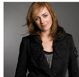
8. Noteer naam en partij: