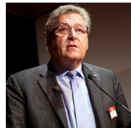
4. Noteer naam en partij