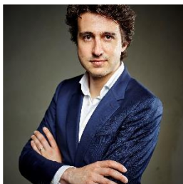
5. Noteer naam en partij