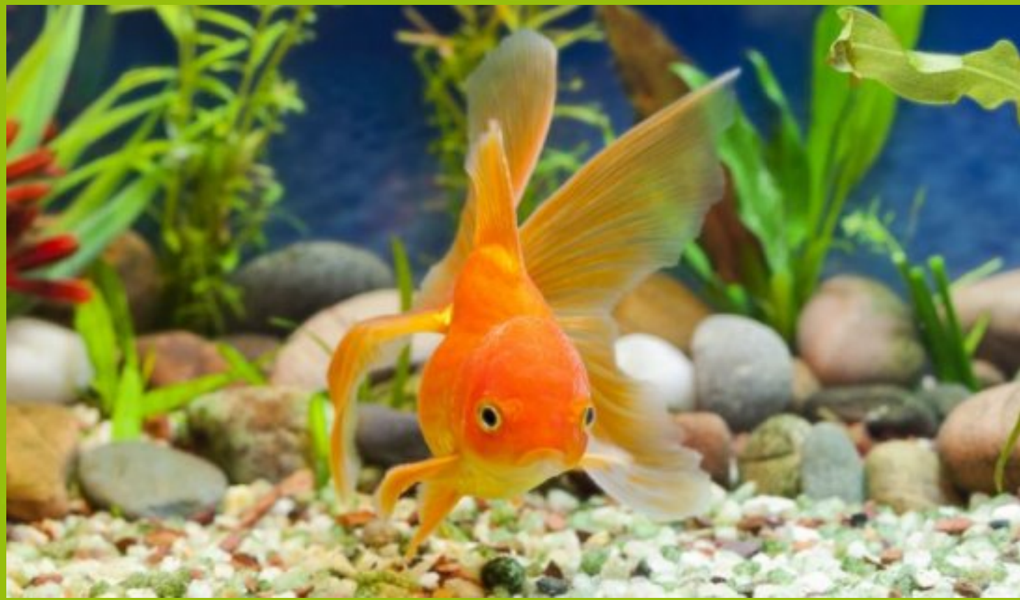
Arie in betere tijden

Geen geclub meer. Het is oorverdovend stil in de kom... Goudvis Arie is niet meer.