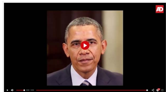
Video over deep fake op AD.nl

De technologie gaat snel vooruit. Ook video's kunnen steeds eenvoudiger bewerkt worden. Deep fake is de technologie waarmee video's aangepast worden met kunstmatige intelligentie. Het onderscheid tussen echt en nep is nauwelijks te maken. Bekijk de video over deep fake op https://www.ad.nl 5