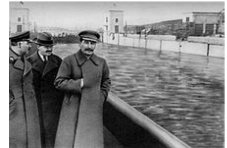
Foto: Origineel en bewerkte foto van Stalin en Yezhov. Public domain via Wikimedia Commons

De technologie gaat snel vooruit. Ook video's kunnen steeds eenvoudiger bewerkt worden. Deep fake is de technologie waarmee video's aangepast worden met kunstmatige intelligentie. Het onderscheid tussen echt en nep is nauwelijks te maken. Bekijk de video over deep fake op https://www.ad.nl 5