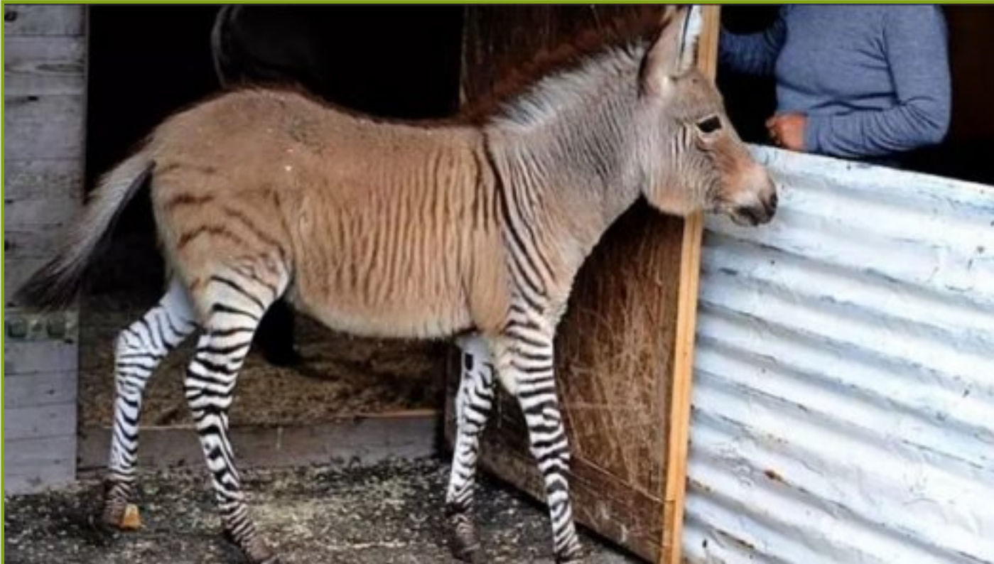
Zezel uit kenia

Een zezel is een kruising tussen een zebra en een ezel. In het Engels heeft het dier de namen zonkey en zedonk. het dier is onvruchtbaar, omdat het een chromosoom mist, en kan dus geen nooit voor een nageslacht zorgen