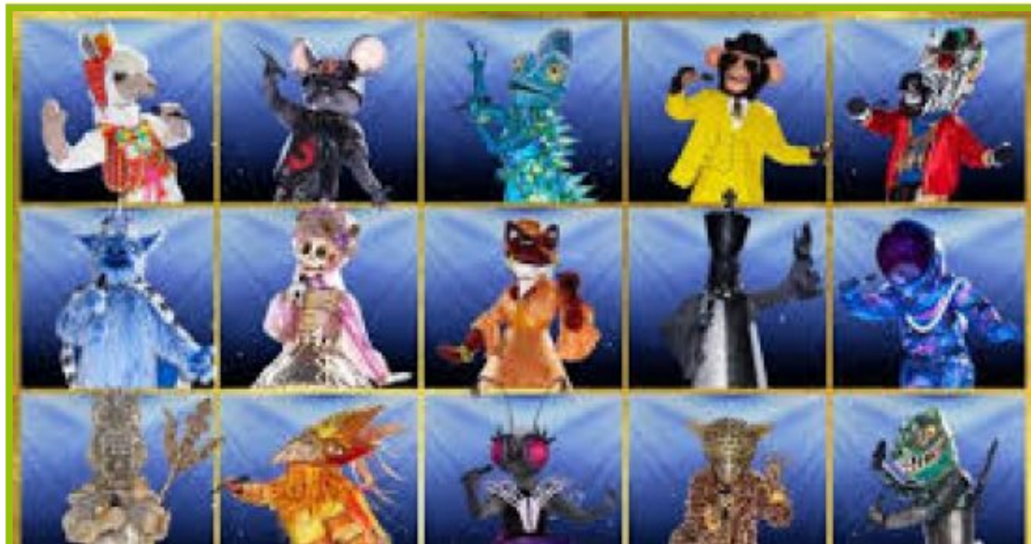
Alle karakters van de masked singers