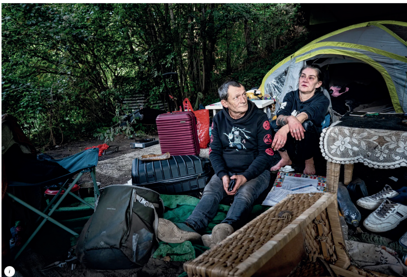
Fotografie Bart Maat