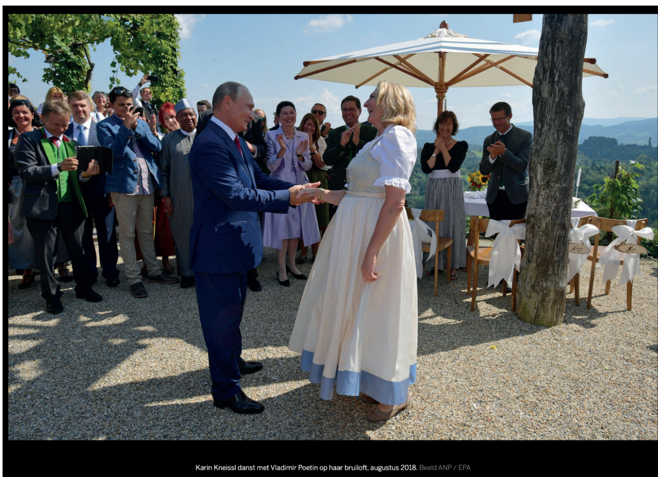
Karin Kneissl danst met Vladimir Poetin op haar bruiloft, augustus 2018.