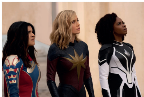
Iman Vellani als Ms. Marvel, Brie Larson als Captain Marvel en Teyonah Parris als Monica Rambeau in de Disney-film 'The Marvels'.

Toenmalig Disney-ceo Bob Chapek beloofde zich tegen de controversiële wet te verzetten, onder meer met een stop op politieke donaties, nadat medewerkers van zijn park uit protest het werk hadden neergelegd. Nadat DeSantis een filmpje had gezien waarin een Disney-animator pleitte voor meer 'queer-verhalen', tekende de gouverneur een wet die de controle over het district 'Disney' wegnam bij het concern. Daarover wordt nu rechtszaak na rechtszaak gevoerd.