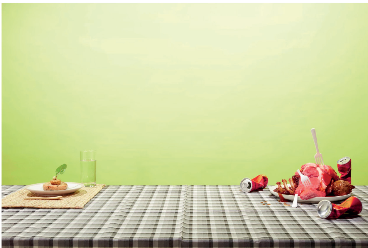
Beeld van santen & bolleurs