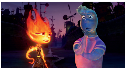
Disneys animatiefilm 'Elemental'.

Het Disney-aandeel kelderde: van 144 dollar in 2019 naar de 84 dollar van vandaag. En de problemen stapelden zich op. Disney-ceo Bob Chapek, in 2020 aangesteld als opvolger van Bob Iger, bleek onvoldoende capabel. Dus keerde Iger twee jaar later alweer terug uit zijn pensioen, om de boel vlot te trekken in zijn tweede ronde als ceo. Afgelopen zomer verslikte hij zich in de staking van acteurs en scenaristen toen hij hun salariseisen 'niet realistisch' noemde. De in Hollywood ooit zo gevierde en gewaardeerde Disney-topman oogstte hoon en woede; als er iets niét realistisch was, riposteerden de vakbondsleden, dan was dat toch eerder Igers eigen salaris-pakket, jaarlijks goed voor 27 miljoen dollar. Vier hoofdpijndossiers waarmee Disney momenteel te kampen heeft.