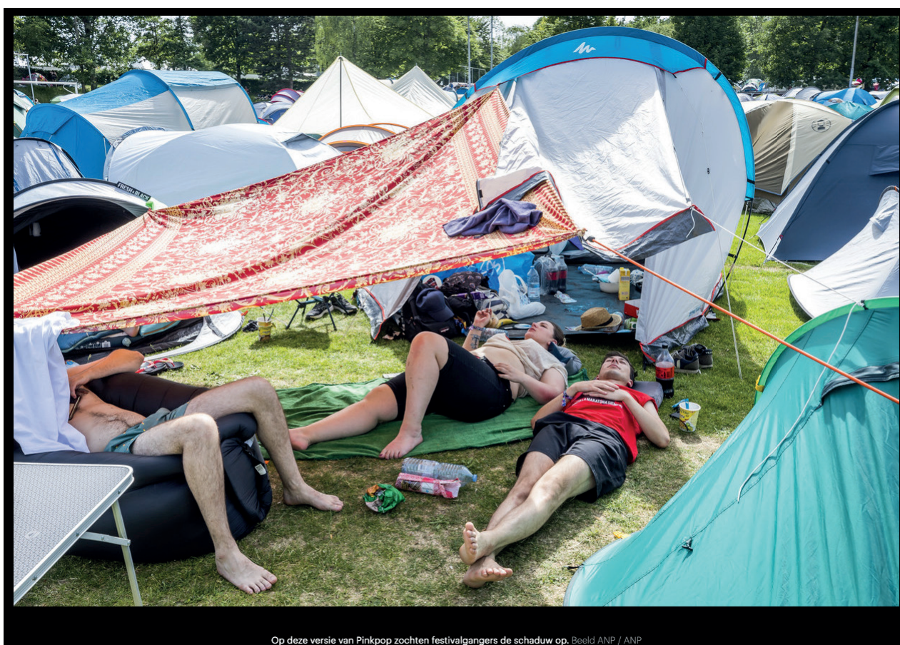
Op deze versie van Pinkpop zochten festivalgangers de schaduw op.