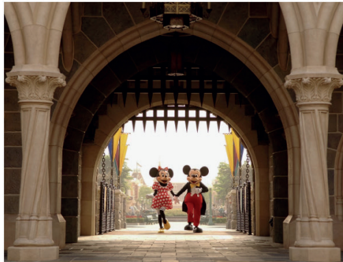
Minnie en Mickey Mouse in een van de Disneyparken.

De broers Walt en Roy Disney konden het ook niet vermoeden toen ze hun bedrijf oprichtten op 16 oktober 1923, precies honderd jaar geleden. Maar het echte Disney-feest is niet nu, dat vond vier jaar geleden al plaats, bij het 96-jarig bestaan van het entertainmentconcern. Alle kassarecords werden gebroken in 2019, toen Disney acht van de tien films met de hoogste opbrengsten van dat jaar opleverde (o.m. Avengers: Endgame , The Lion King , Frozen II , Toy Story 4 , Star Wars: The Rise of Skywalker ). In totaal werd er zo'n 13 miljard aan recettes opgehaald; meer dan welke filmstudio ooit.