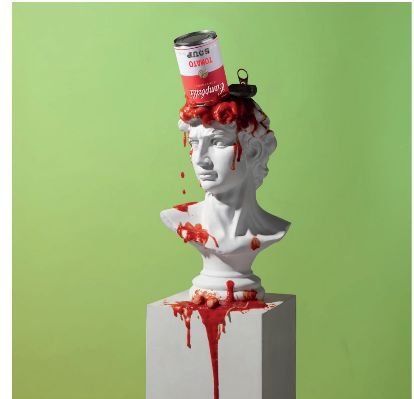
Beeld Van Santen & Bolleurs