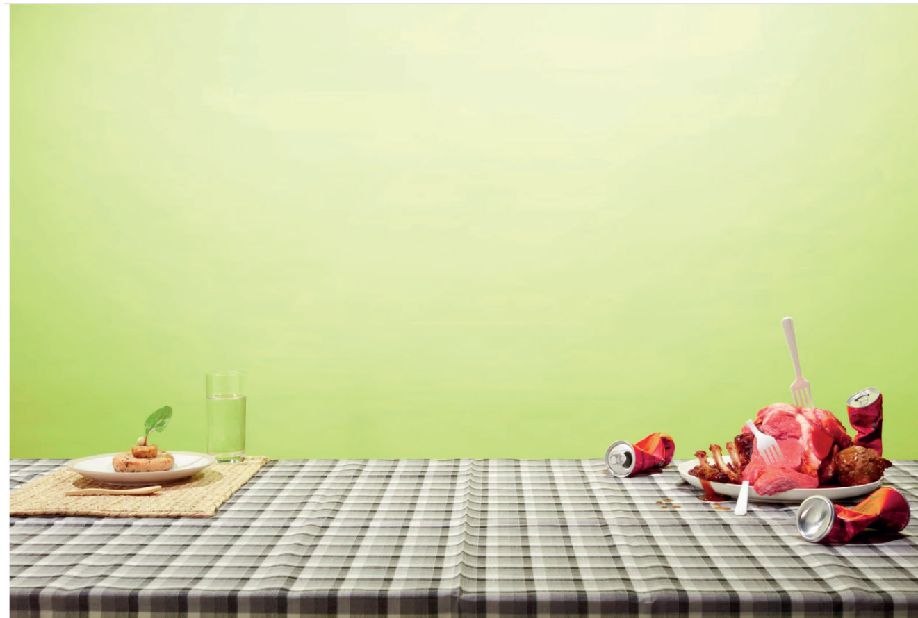
Beeld van santen & bolleurs