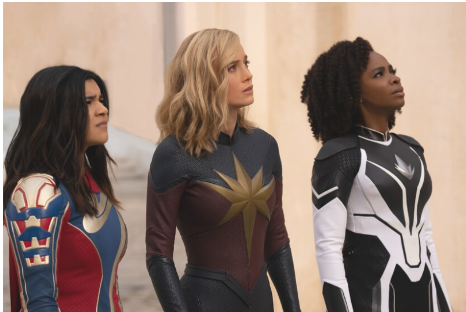
Iman Vellani als Ms. Marvel, Brie Larson als Captain Marvel en Teyonah Parris als Monica Rambeau in de Disney-film 'The Marvels'.

Toenmalig Disney-ceo Bob Chapek beloofde zich tegen de controversiële wet te verzetten, onder meer met een stop op politieke donaties, nadat medewerkers van zijn park uit protest het werk hadden neergelegd. Nadat DeSantis een filmpje had gezien waarin een Disney-animator pleitte voor meer ‘queer-verhalen’, tekende de gouverneur een wet die de controle over het district ‘Disney’ wegnam bij het concern. Daarover wordt nu rechtszaak na rechtszaak gevoerd.