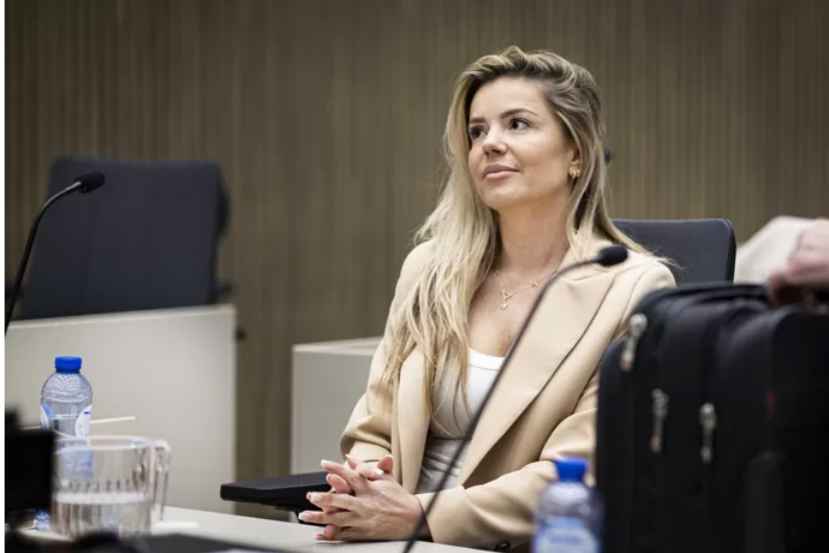
▲ Yvonne Coldeweijer.