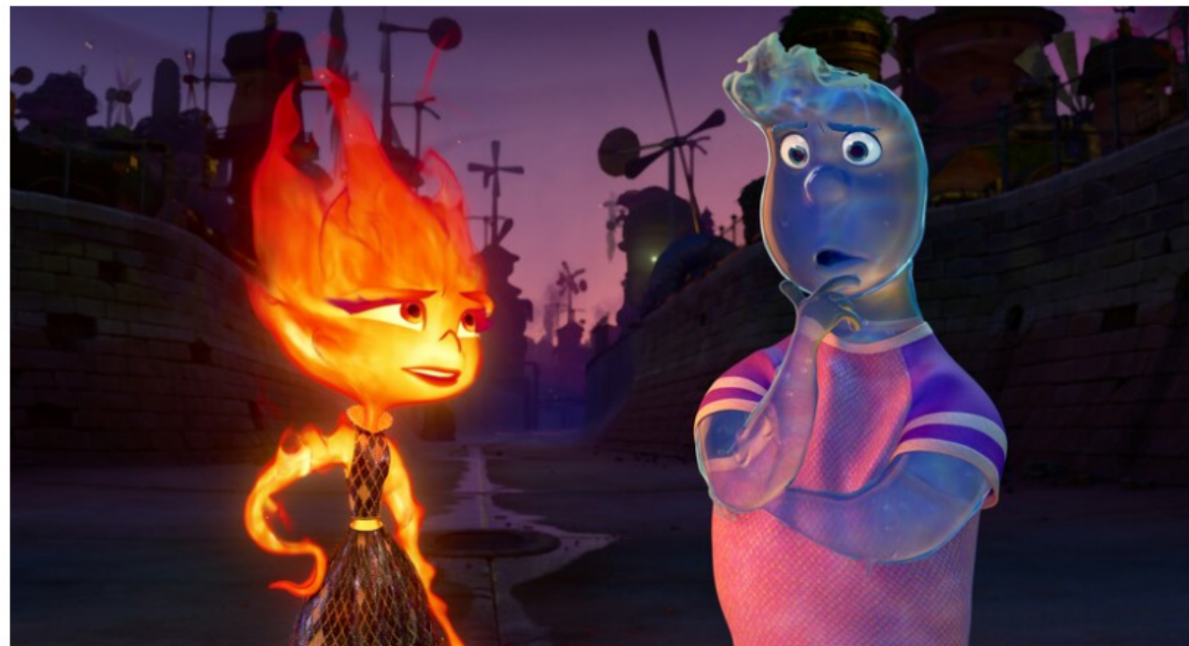
Disneys animatiefilm 'Elemental'.

Het Disney-aandeel kelderde: van 144 dollar in 2019 naar de 84 dollar van vandaag. En de problemen stapelden zich op. Disney-ceo Bob Chapek, in 2020 aangesteld als opvolger van Bob Iger, bleek onvoldoende capabel. Dus keerde Iger twee jaar later alweer terug uit zijn pensioen, om de boel vlot te trekken in zijn tweede ronde als ceo. Afgelopen zomer verslikte hij zich in de staking van acteurs en scenaristen toen hij hun salariseisen ‘niet realistisch’ noemde. De in Hollywood ooit zo gevierde en gewaardeerde Disney-topman oogstte hoon en woede; als er iets níét realistisch was, riposteerden de vakbondsleden, dan was dat toch eerder Igers eigen salaris-pakket, jaarlijks goed voor 27 miljoen dollar. Vier hoofdpijndossiers waarmee Disney momenteel te kampen heeft.