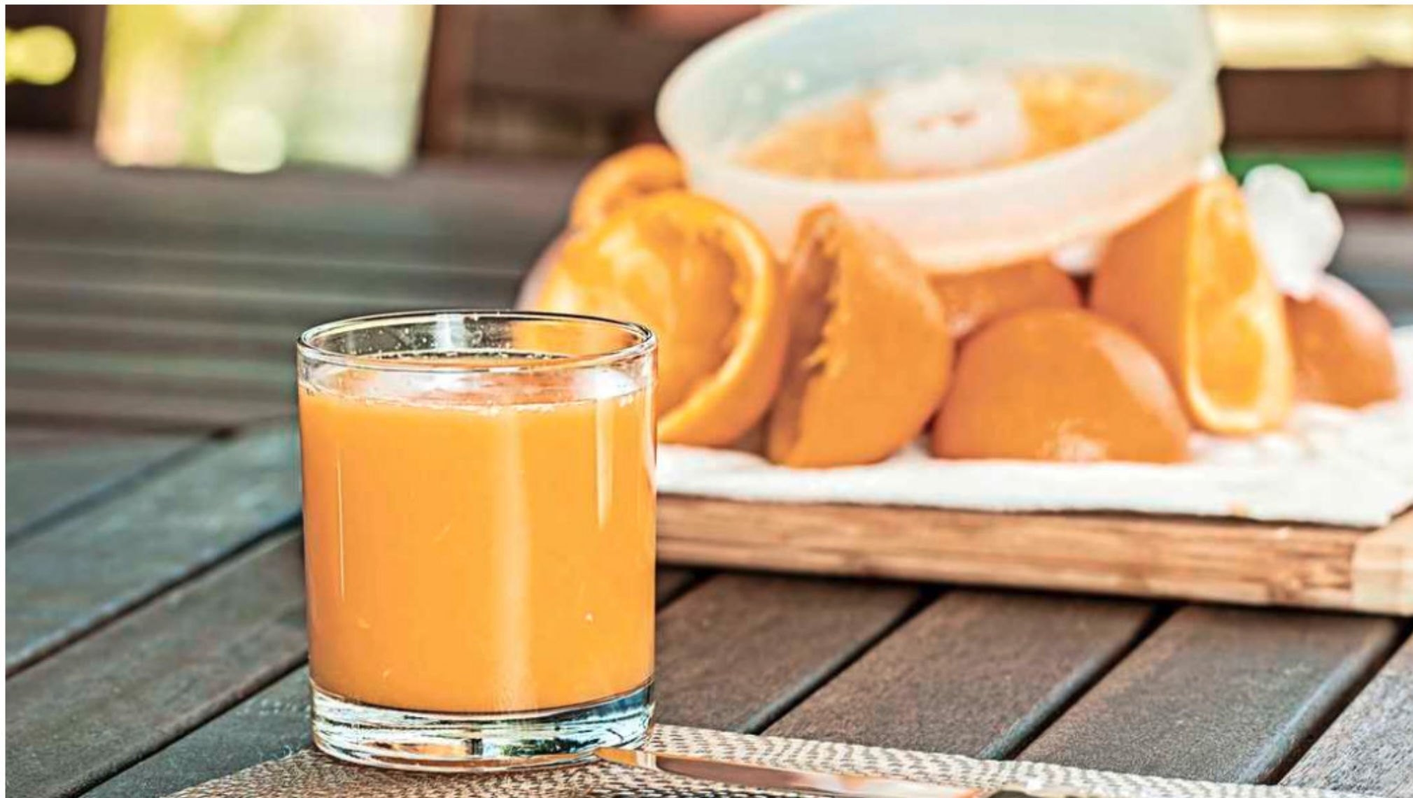
Extra sinaasappels voor extra vitamine C zijn voor je weerstand niet direct beter

Wil je aan je weerstand werken om deze herfst en winter niet (al te) ziek te worden van de griep? Grijp dan niet blind naar vitamine C-supplementen. Te veel van deze vitamine is namelijk ook niet goed voor je.