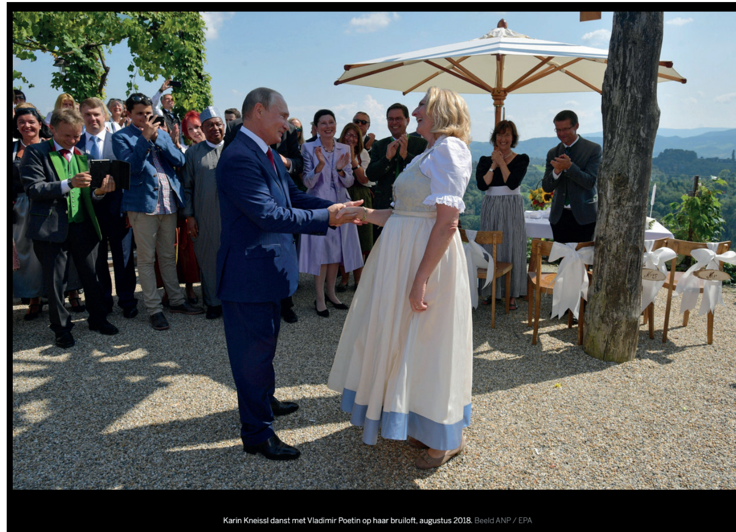
Karin Kneissl danst met Vladimir Poetin op haar bruiloft, augustus 2018.

De verloofden lachen en kijken opgetogen, maar het is ze menens. Dit is een boodschap, een waarschuwing