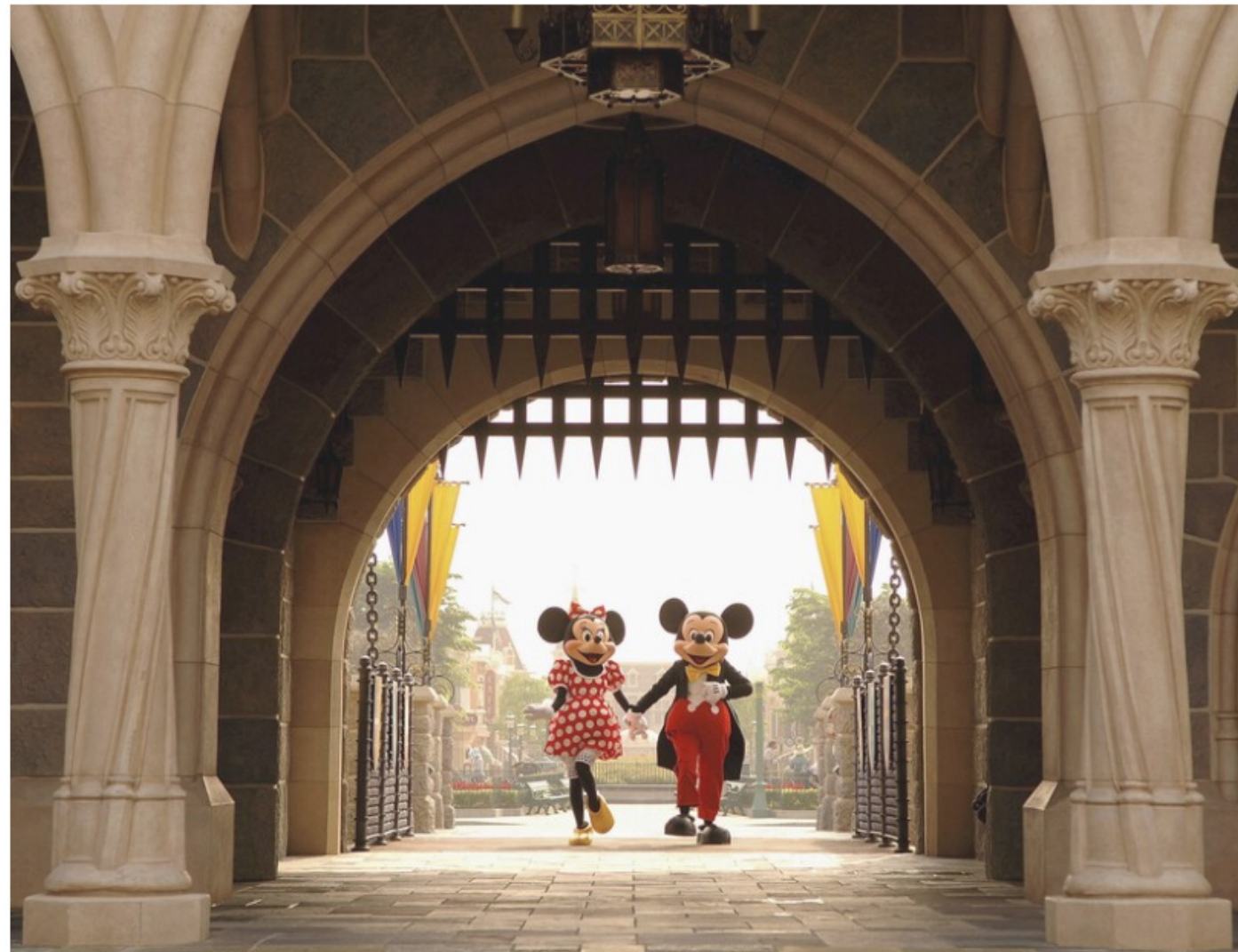
Minnie en Micky Mouse in een van de Disneyparken.

De broers Walt en Roy Disney konden het ook niet vermoeden toen ze hun bedrijf oprichtten op 16 oktober 1923, precies honderd jaar geleden. Maar het échte Disney-feest is niet nu, dat vond vier jaar geleden al plaats, bij het 96-jarig bestaan van het entertainmentconcern. Alle kassarecords werden gebroken in 2019, toen Disney acht van de tien films met de hoogste opbrengsten van dat jaar opleverde (o.m. Avengers: Endgame , The Lion King , Frozen II , Toy Story 4 , Star Wars: The Rise of Skywalker ). In totaal werd er zo'n 13 miljard aan recettes opgehaald; meer dan welke filmstudio ooit.