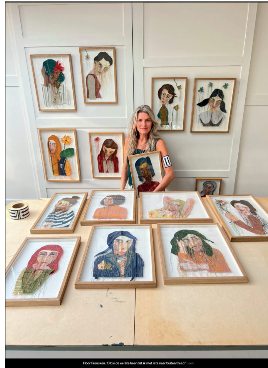
Floor Francken: 'Dit is de eerste keer dat ik met iets naar buiten breed' (2022)

Een verlegen eerbetoon aan muurbloempjes: 'Het fijne is dat je niet zo snel oordeelt'