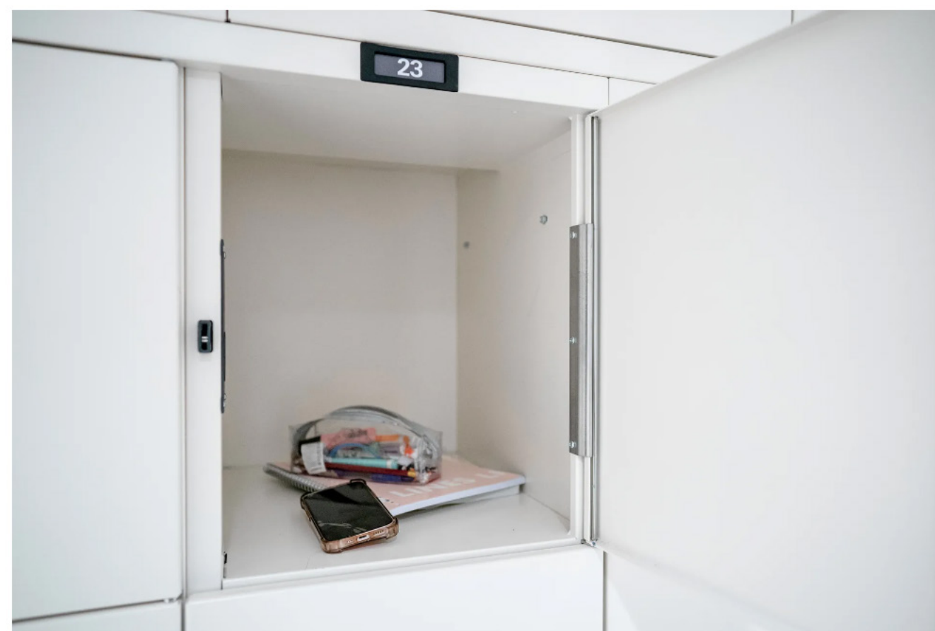
Sommige scholieren bewaren hun telefoon in een kluisje.

Over het algemeen zijn docenten enthousiast over het mobieltjesverbod, zeggen de scholen die NRC sprak. „Kinderen waren altijd veel afgeleid. En er werd van alles en nog wat gefotografeerd en gefilmd en op sociale media geplaatst”, zegt Kingma. „Maar het belangrijkste is die concentratieboog: we merkten na de zomer, toen we de aanpak al wat verscherpt hadden, dat die al beter was.”