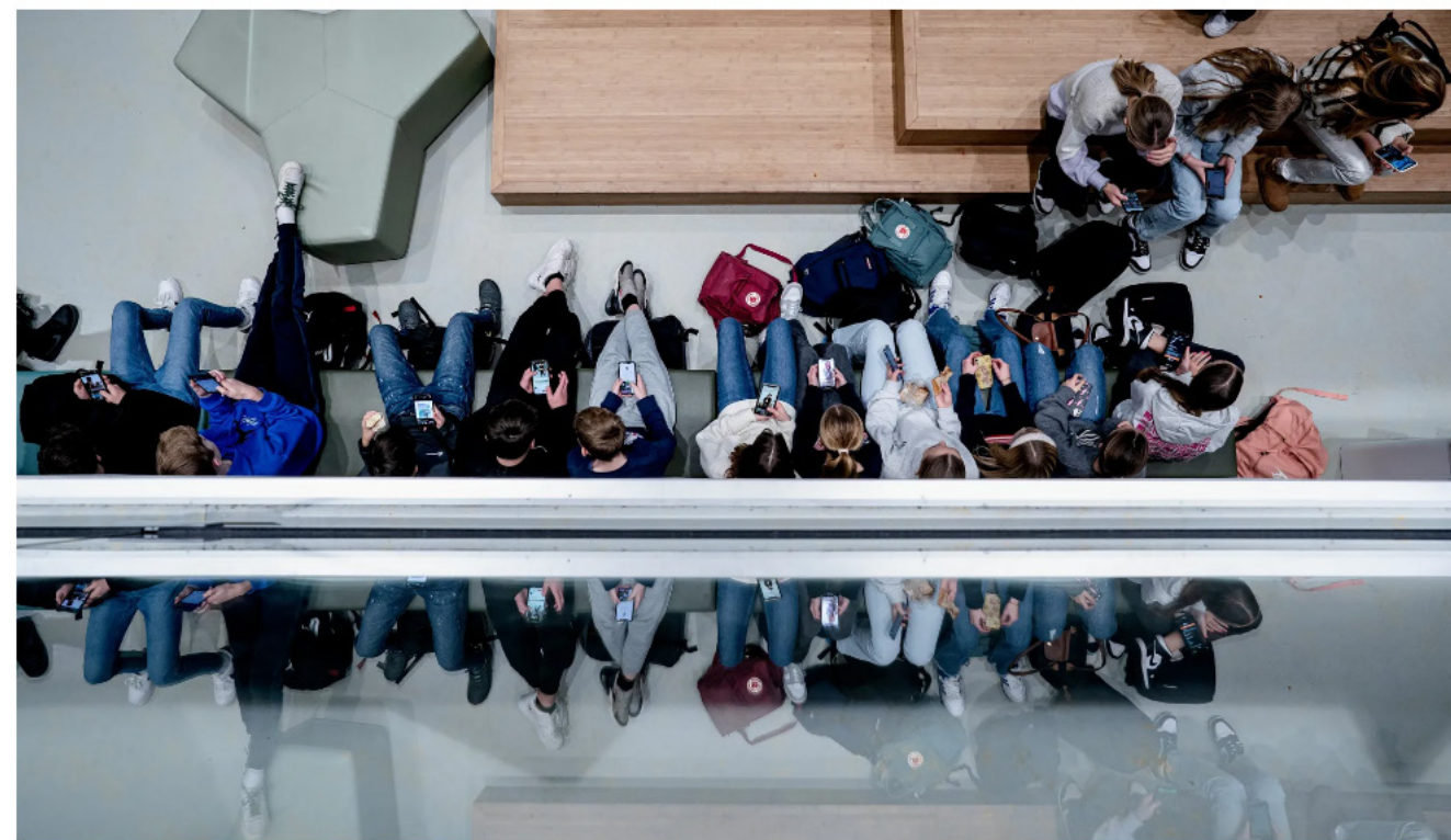
Scholieren kijken op hun telefoons in de pauze op het Leonardo College in Leiden. Deze foto is genomen na de telefoonvrije oefenweek.

Scholen mogen zelf beslissen hoe ze invulling geven aan de afspraak. Op het Leonardo College - een school voor mavo, havo en vwo - oefenden de leerlingen begin december een week met de regel 'thuis of in de kluis'. Ook in pauzes en tussenuren mochten de telefoons niet tevoorschijn worden gehaald. Na de oefenweek besloot de school - na een enquête onder leerlingen - voorlopig geen totaalverbod in te stellen en de telefoon alleen uit de klas te weren.