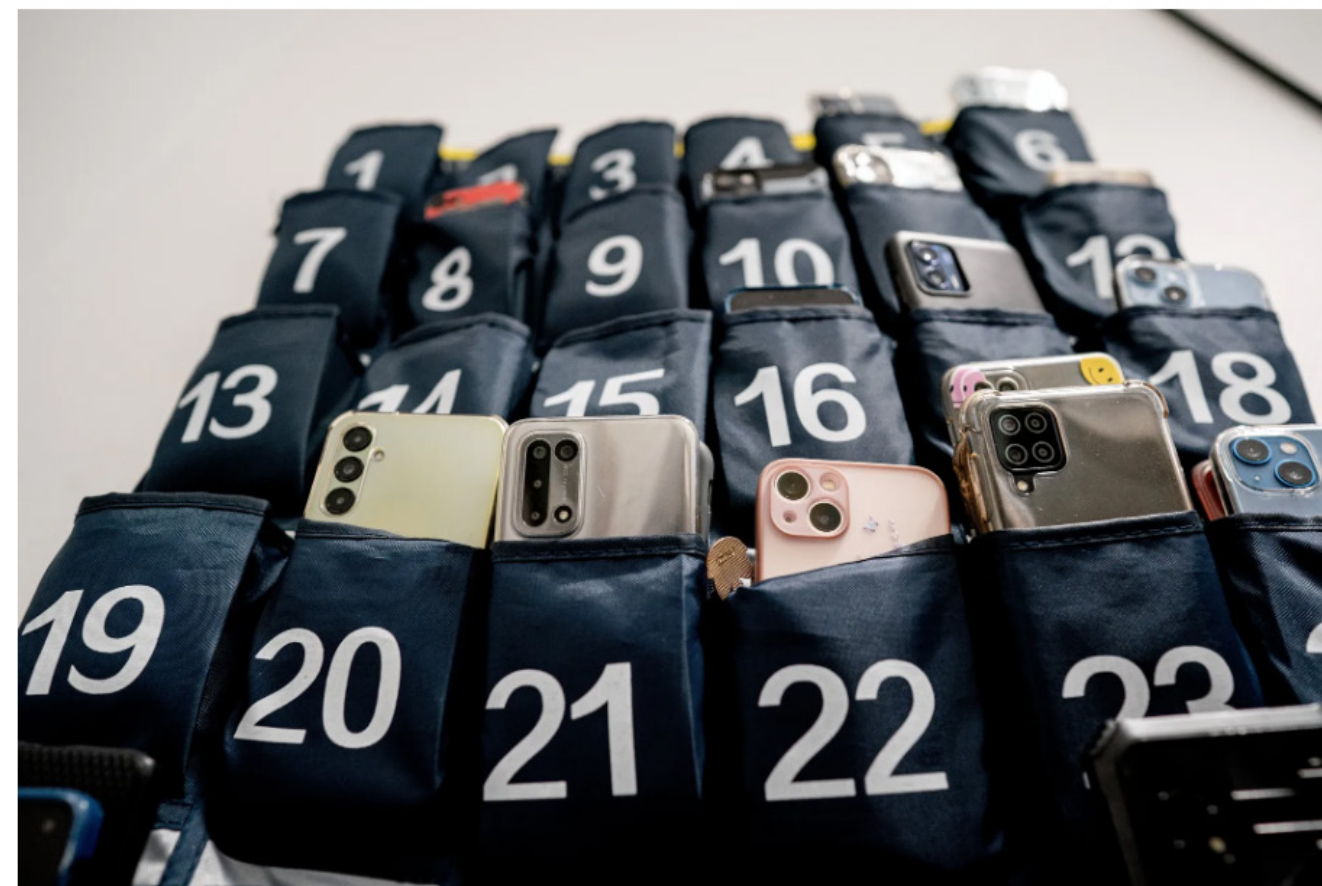
Tijdens de les kunnen telefoons van scholieren worden opgeborgen in dit soort telefoonzakken.

Een meisje kijkt voor de laatste keer op haar telefoon, die een stuk groter is dan haar hand. Daarna stopt ze het ding, met het scherm nog opgelicht, diep in haar schoolkluis. Dan gaat de bel. Het is half negen 's ochtends, begin december. De drom leerlingen bij de kluisjes en kapstokken op het Leonardo College in Leiden zet langzaam koers naar de eerste les. Geen van hen heeft een mobiele telefoon in de hand, een gek beeld bij deze generatie tieners. „We zitten in 2.6!” „Heb je nog een beetje geleerd?” „Waar is de rest?!”