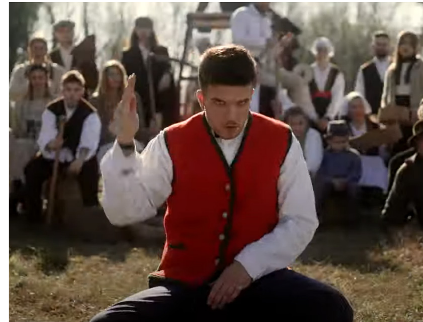
Kroatië | Baby Lasagna - Rim Tim Tagi Dim

Bekijk klassikaal drie Songfestival-inzendingen van dit jaar. Tijdens het kijken bedenken de leerlingen vast wat hen opvalt, aantekeningen maken mag.