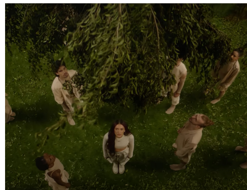
Israël | Eden Golan - Hurricane

Verdeel de klas in groepen van 4-6 leerlingen.