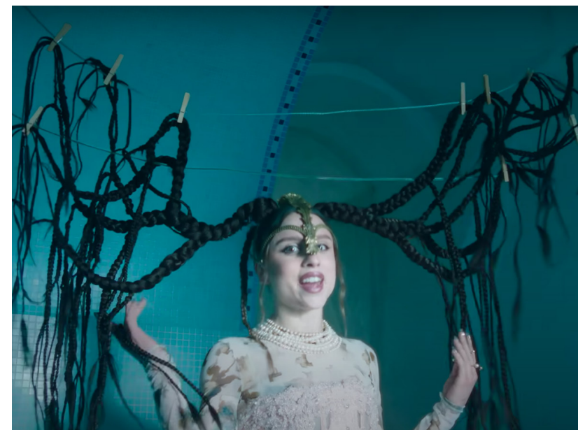
Italië | Angelina Mango - La noia