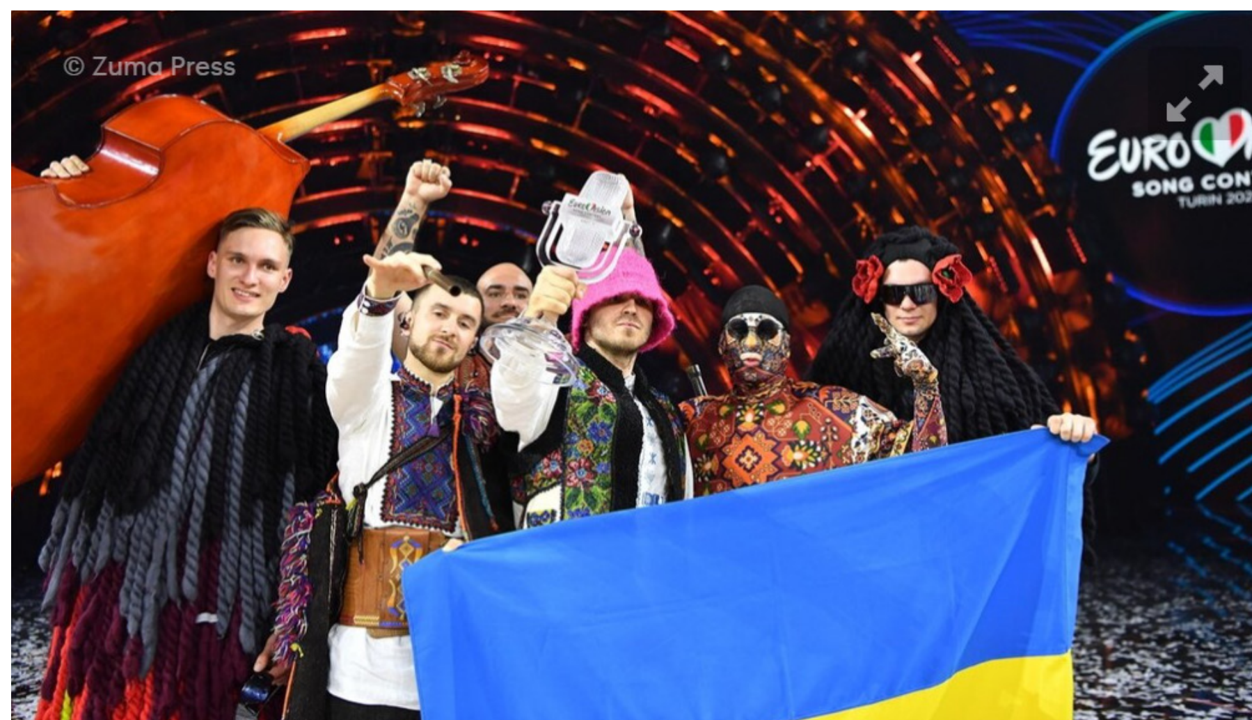
In 2022, het jaar dat Rusland werd uitgesloten van deelname, won Oekraïne.

De organisatie wil verder geen uitspraken doen over het verschil tussen de uitsluiting van Rusland in 2022 en de discussie rondom de deelname van Israël. "Vergelijkingen tussen oorlogen en conflicten zijn erg complex en ingewikkeld. Als niet politieke mediaorganisatie maken wij dat soort vergelijkingen niet."